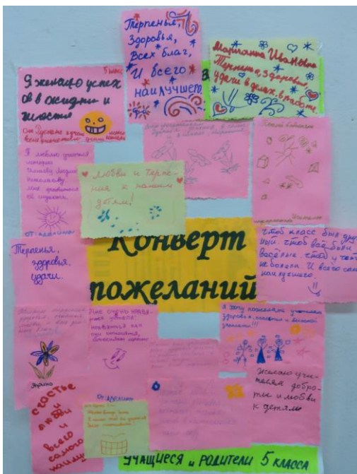
Совместный проект детей и родителей «Конверт пожеланий».