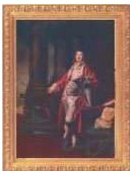
Прокофий Акинфиевич Демидов (1710-1786)

К концу жизни (1745 г.) Акинфию Демидову принадлежали 25 металлургических предприятий, строил дороги, суда, возводил пристани для доставки металла и оружия в столицу, всемерно поощрял поиски рудных месторождений, привлекал для работы на заводах иностранных специалистов и даже сам побывал в Саксонии, откуда привез коллекцию минералов, положившую начало фамильной традиции собирания раритетов.