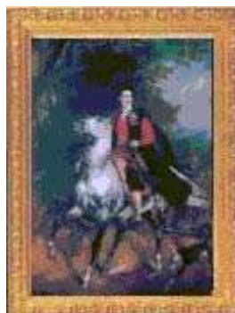
Анатолий Николаевич Демидов (1813-1870)