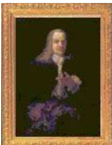
Акинфий Никитич Демидов (1678-1745)

В начале Северной войны поставил в казну партию ружей по цене 1 руб.80 коп. за штуку, в то время как военное ведомство покупало их по 12-15 руб., и безвозмездно пожертвовал большое количество ядер. Большую помощь Петру I оказал Никита Демидов и при построении новой столицы - Петербурга, поставив по заказу императора 81 300 пудов чугунных и железных фонтанных труб, изготовленных невянскими мастерами для Летнего сада в Петербурге и для Петергофа. 21 сентября 1720 г. вышел указ о пожаловании его в дворяне.