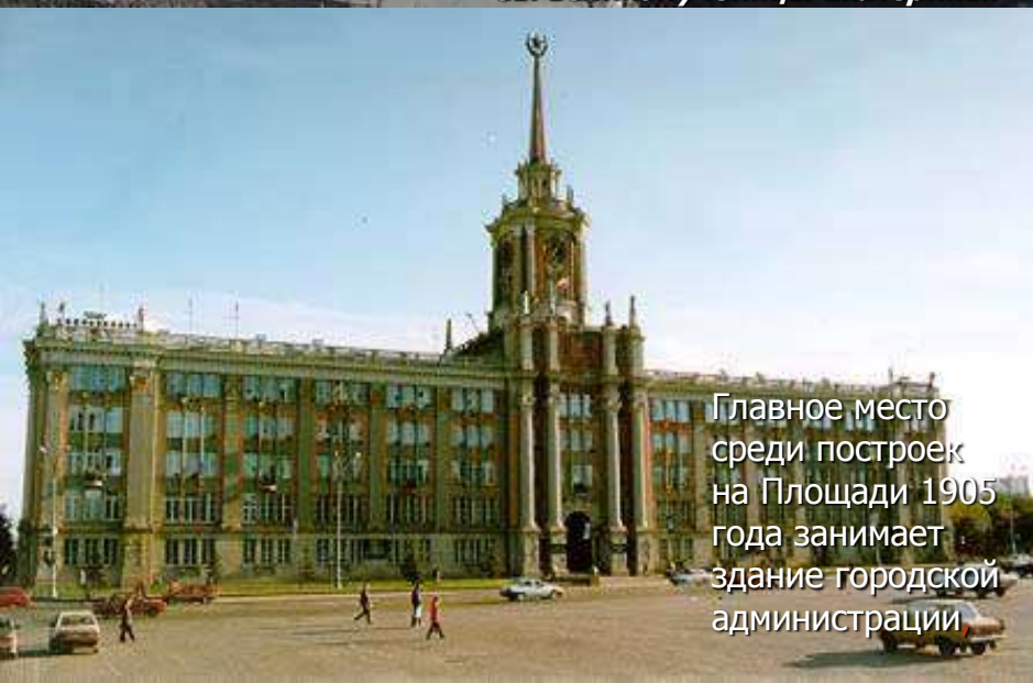
Главное место среди построек на Площади 1905 года занимает здание городской администрации