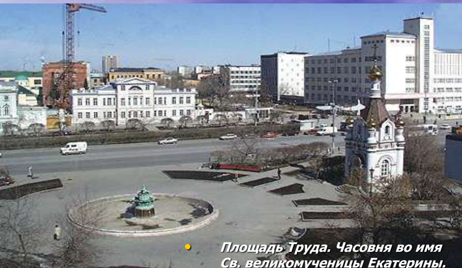
• Площадь Труда. Часовня во имя Св. великомученицы Екатерины.