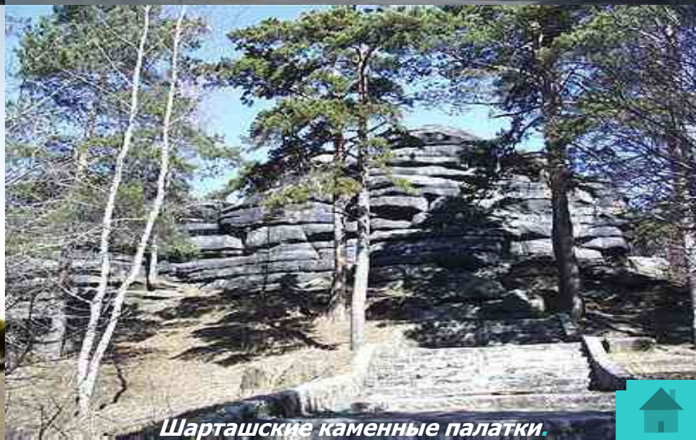
Шарташские каменные палатки.