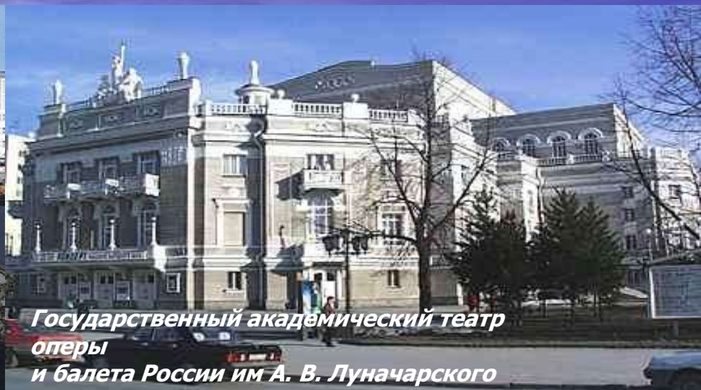
Государственный академический театр оперы и балета России им А. В. Луначарского