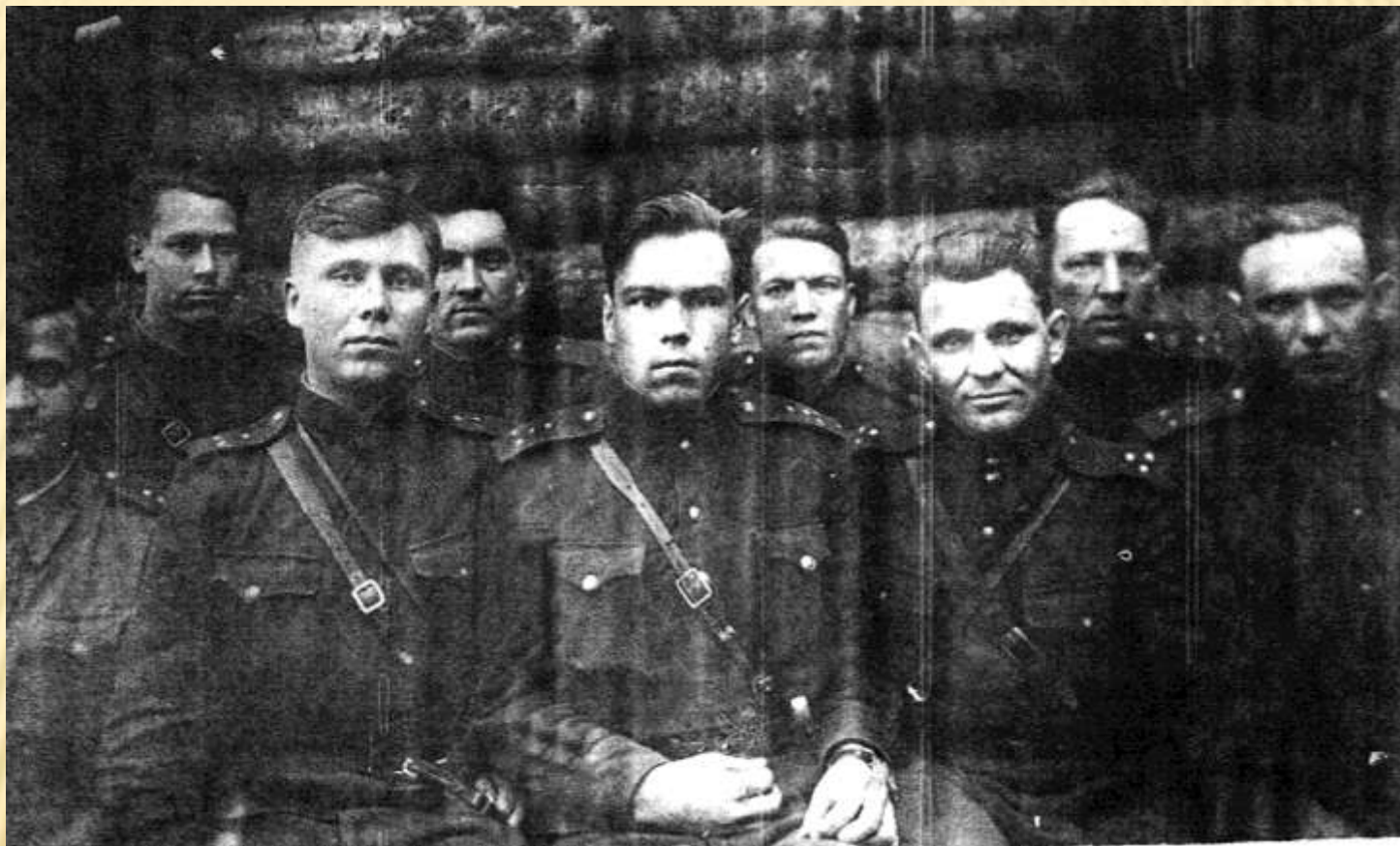
1943 год - Волховский фронт